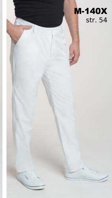
M-140X str. 54