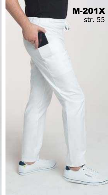
M-201X str. 55