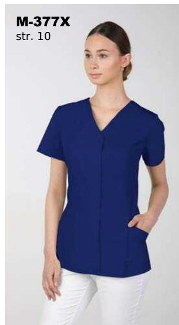
M-377X str. 10