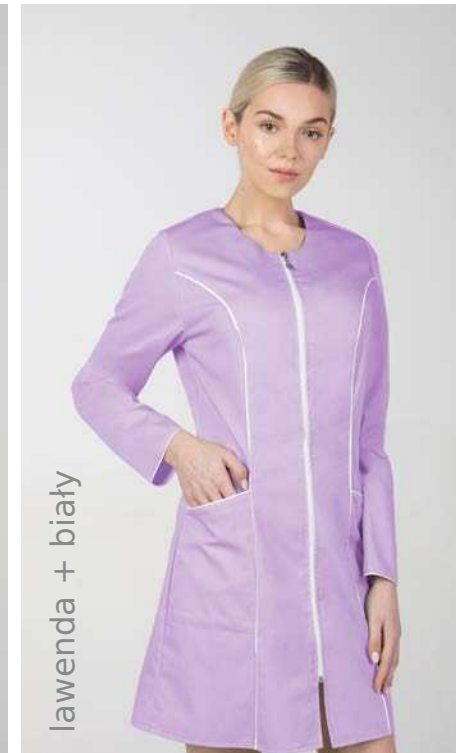
lawenda + biały