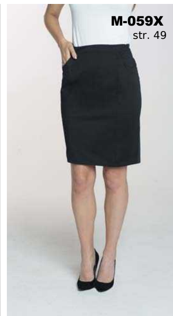
M-059X str. 49