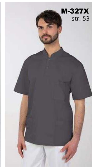
M-327X str. 53