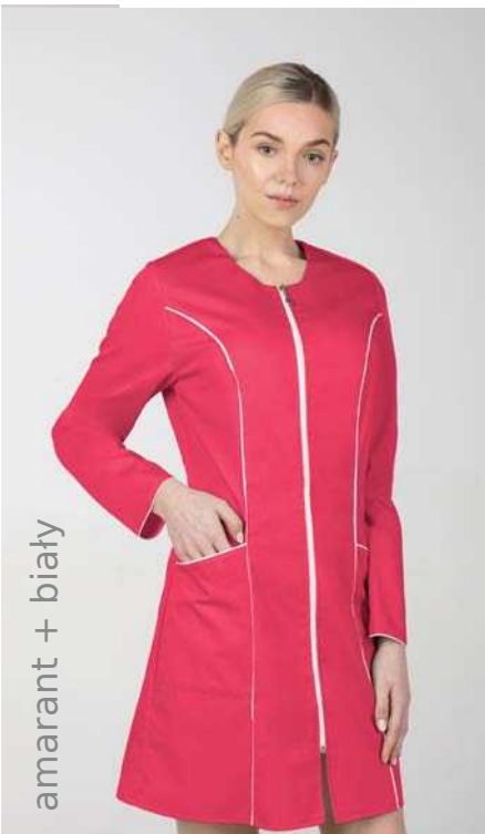
amarant + biały