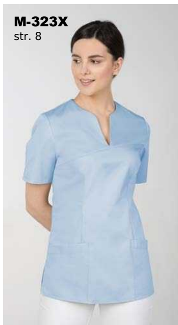
M-323X str. 8