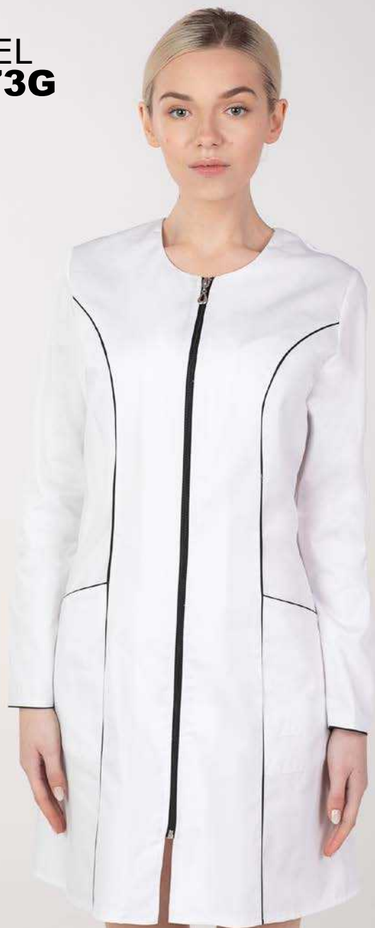
biały + czarny