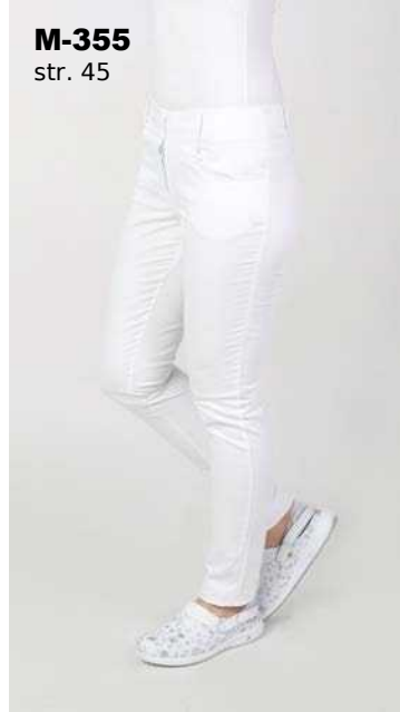
M-355 str. 45