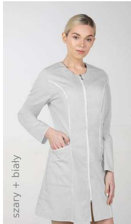
szary + biały