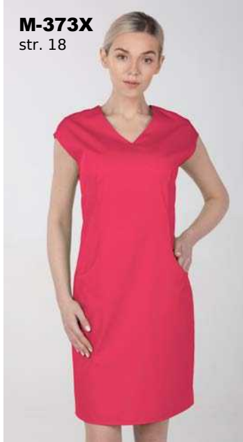
M-373X str. 18