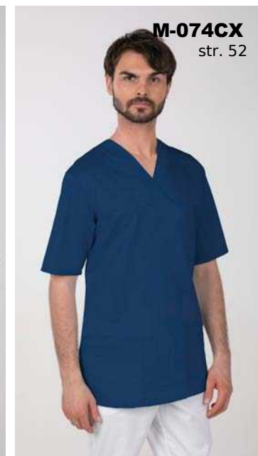
M-074CX str. 52