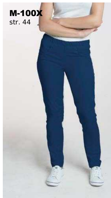
M-100X str. 44