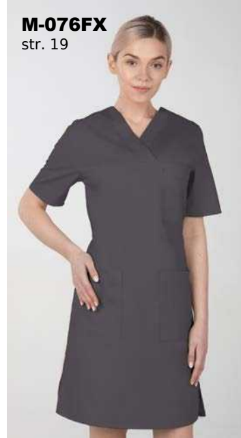
M-076FX str. 19