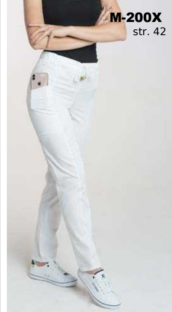
M-200X str. 42